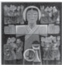
Von Hongkong nach Winnipeg