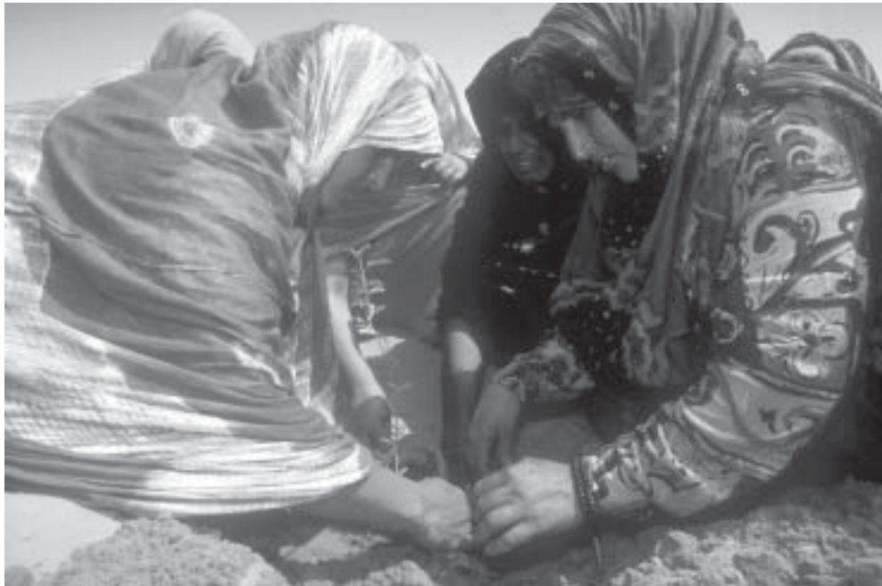
Frauen in Mauretanien pflanzen Bäume, die später Tierfutter liefern und eine Einkommensquelle für das Gemeinwesen bieten. So sorgen sie für die Zukunft ihrer Dörfer vor.

das Rahmenabkommen „Operation Partnerschaft“. Auf der Grundlage dieser Vereinbarung „werden UNHCR und LWB eine aktive Arbeitsbeziehung durch gemeinsame Verpflichtung auf höchste Verhaltensstandards, verbesserte Mechanismen für Konsultation und Zusammenarbeit, koordinierte Programmplanung und -umsetzung, wirksame Nutzung von Ressourcen und Koordination der jeweiligen Sicherheits- und Kommunikationsstrategien entwickeln“.