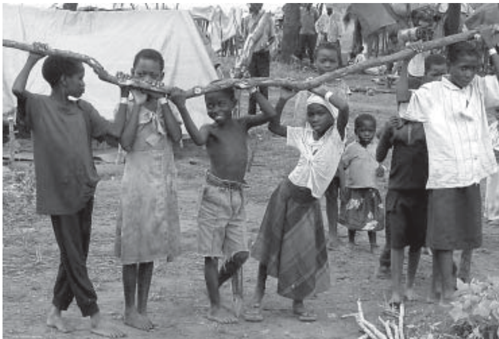
Ein Flüchtlingslager in Sambia.

Das Ziel des Programms zur Entwicklung von Ackerbau und Viehzucht Karamoja (Karamoja Agro-Pastoral Development Program, KAPDP) ist es, Menschen zu unterstützen, die Ackerbau und Viehzucht mit Blick auf die Schaffung einer realistischen Existenzgrundlage für Familien betreiben wollen. Ziele dabei sind die Verbesserung der Ernährungssicherheit der Haushalte und die Stärkung der Überlebensstrategien der einheimischen Bevölkerung durch besondere Förderung von Getreidebanken, Tiergesundheit und Wasserversorgung unter eigenständiger Verwaltung der Gemeinwesen. Die gemeindeeigenen