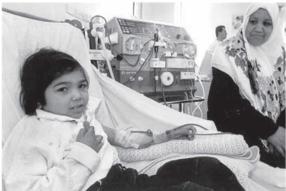
Eine junge Dialyse-Patientin im Auguste Victoria-Krankenhaus, Ostjerusalem.

In den Länderprogrammen wurde mit Blick auf humanitären Dienst und Entwicklungsmanagement ein reicher Erfahrungsschatz zusammengetragen. Es gibt reichlich Gelegenheiten, diese Erfahrungen miteinander zu teilen und zu übertragen und Kapazitäten vor Ort aufzubauen. Die AWD muss keineswegs bei Null anfangen. Vielfach verfügen die Gemeinwesen bereits über umfangreiche Kenntnisse, Fertigkeiten und wertvolle Erfahrungen. Wir können von ihnen lernen, während wir ihnen durch angemessene Schulungen technisches und organisatorisches Know-how vermitteln. Damit schaf-