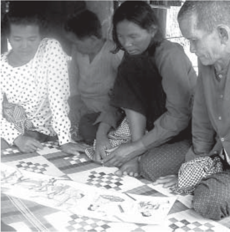
Ausbildung traditioneller Hebammen.

Partnerorganisationen, staatliche Hilfsprogramme, die Europäische Anstalt für Wiederaufbau und Einzelpersonen. Für den Erfolg des Programms waren das Engagement und der Einsatz langjährig gedienter einheimischer MitarbeiterInnen von ausschlaggebender Bedeutung.