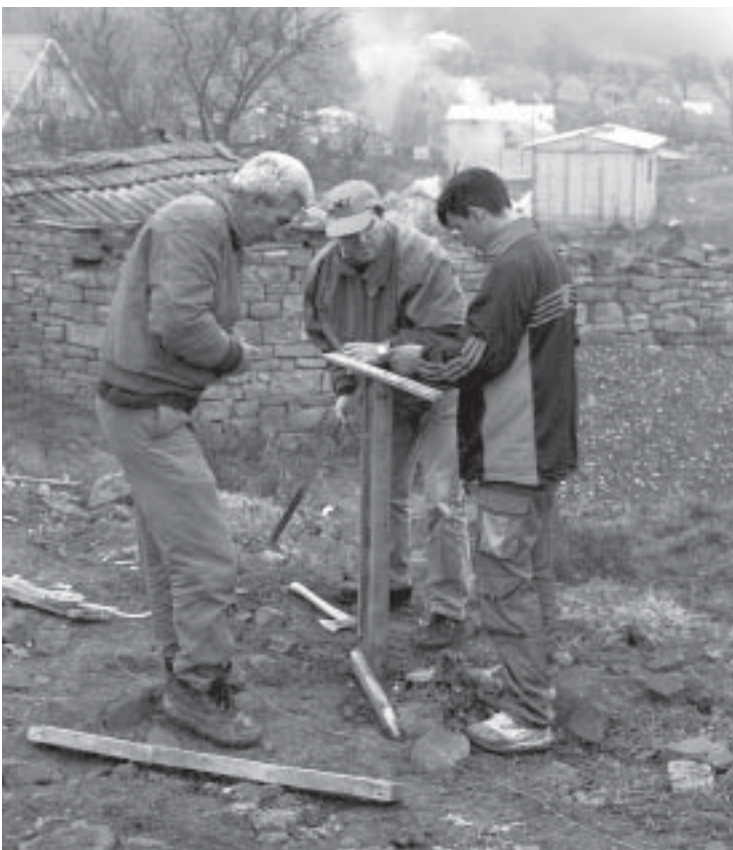
Wiederaufbau von Wohnhäusern auf dem Balkan (Kosovo).

Seit 1992 unterstützt das Kroatien-Programm Flüchtlinge beim Wiederaufbau ihrer Häuser und der sozialen Infrastruktur, wie Kindergärten,