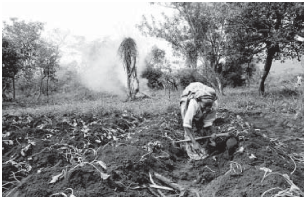
Ruanda: Der Gemüsegarten eines Projekts zur Ernährungssicherung.

Wandel der Regierungspolitik in Bezug auf internationale Entwicklungs- und Nothilfearbeit leistende NGOs hat zu einem Wechsel hin zur Arbeit mit nationalen NGOs geführt. 1998 beschäftigte LWB-Nepal noch 230 MitarbeiterInnen, doch diese Zahl wurde bis Anfang 2003 auf 150 (23 Prozent Frauen) abgebaut. Dazu kommen ungefähr 500 Freiwillige von Basisorganisationen. Die Verlagerung auf eher indirekte Massnahmen über zwischengeschaltete NGOs und an der Basis angesiedelte gemeinschaftsbezogene Organisationen – soweit es die Sicherheitslage gestattet – wird einen weiteren Personalabbau nach sich ziehen. Insbesondere im Kontext der Befähigungsprojekte wurde ein nachhaltiges Programm zur menschlichen Entwicklung durchgeführt. LWB-Nepal diente auch als zentrale Anlaufstelle für das Asian Zone Emergency and Environment Cooperation Network (AZEECON), das andere Asien-Programme von LWB/AWD mit einbezieht und neue Konzepte, Austausch und Personalentwicklung fördert.