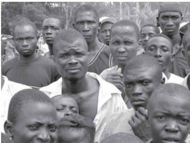
Viele Binnenvertriebene in Liberia werden auf der Flucht aus Kriegsgebieten von ihrer Familie getrennt.

LWB und UNHCR verbindet eine langjährige, fruchtbare Beziehung. Im Dezember 2000 unterzeichneten sie mit Blick auf die Verbesserung ihrer Zusammenarbeit bei der Flüchtlingsarbeit