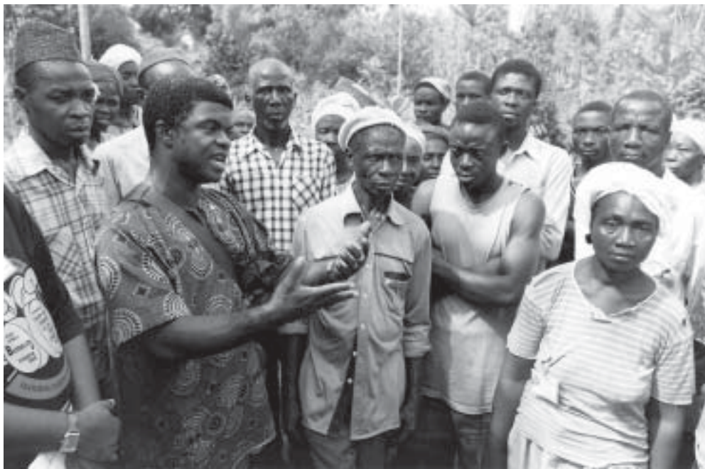
DorfbewohnerInnen in Liberia wird Traumaheilung und Versöhnung nahegebracht.

Einer Bitte der ELKSL und anschliessenden Sondierungsbesuchen folgend startete das Liberia-Programm im Jahr 2000 Aktivitäten zur Unterstützung der ELKSL-Nothilfemassnahmen im Rahmen des Nothilfe- und Wiederaufbauprogramms des Vereinigten Christenrates von Sierra Leone. Die einleitenden Massnahmen wurden in Form von Nothilfeinterventionen durchgeführt, die von ACT-GeberInnen finanziert wurden.