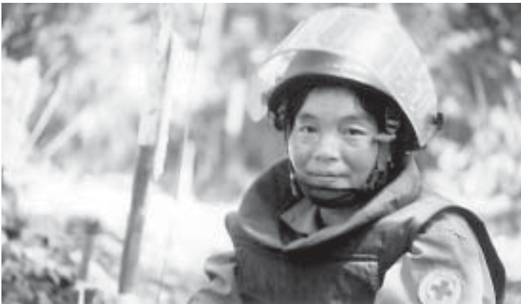
Im Rahmen des Kambodscha-Programms wird auch ein Minenräumtraining durchgeführt.

Das Umweltnetzwerk der Länderprogramme hat das Ziel, den Einsatz des LWB für die Umwelt zu verbessern. Dieses Netzwerk ist als Unterstützung für die Länderprogramme gedacht, es ermöglicht Umweltschulung sowie die Anpassung und Integration der regionalen Bedingungen an den ökologischen Ansatz des LWB. Zu den heute in Angriff genommenen Aufgaben gehört die Integration von Umweltstandards in Nothilfeinsätze und von Umweltaspekten in die Sphere-Standards als unverzichtbare Voraussetzung von ACT-Spendenaufrufen. Eine weitere grosse Aufgabe ist das Eintreten für ökologisch vertretbares Verhalten: genetisch veränderte Organismen, Patente auf Saatgut und Lebensformen, ökologisch vertretbare Landwirtschaft sowie Klimaveränderungen und ähnliches. Alles dies sind Fragen, mit denen sich die AWD in Zusammenarbeit mit ihren Partnern weiterhin auseinandersetzen wird.