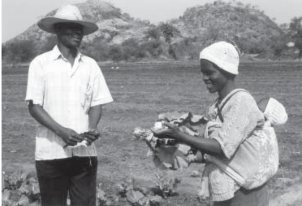
Projekt im Bereich ländliche Entwicklung, Simbabwe.

Die Infrastrukturunterstützung zielt auf die Wiederherstellung und den Aufbau der sozialen Infrastruktur ab. Hierzu zählen Schulräume, Unterkünfte für Lehrkräfte und Krankenstationen ebenso wie die Zentren für Entwicklungsverbände, von denen mehrere Schulen und Gemeinschaften profitiert haben.