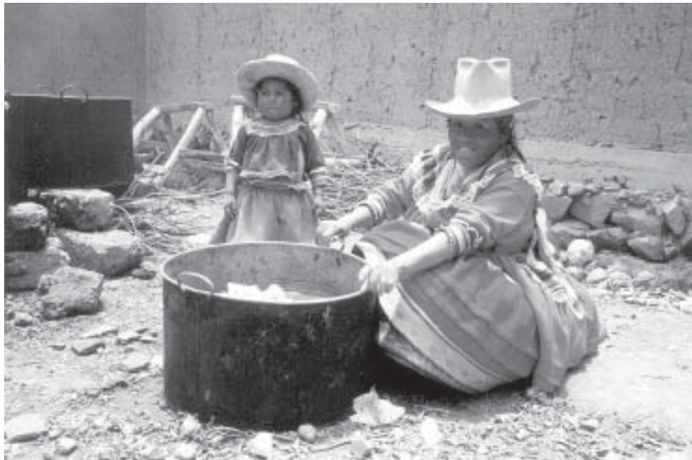
Diese peruanische Mutter bereitet eine Suppe aus Kartoffeln und Kohl zu, die sie im Garten der Familie in den Anden geerntet hat.

Diaconia verfolgt einen zunehmend entwicklungsorientierten Ansatz und hat sich auf die Durchführung ländlicher Entwicklungsprogramme in einigen der ärmsten Andenregionen von Ancash, Huancavelica, Huánuco