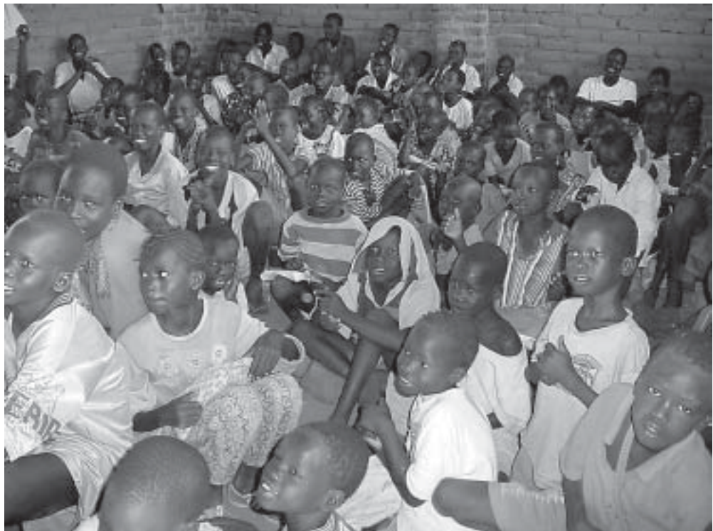
Ein Klassenzimmer im Flüchtlingslager Kakuma, Nordkenia.

halb dessen die AWD ihre Arbeit ansiedelt. Grosser Bedarf besteht auch am Aufbau der Kapazität der verschiedenen (an Management, Leitung und Regierungsführung) Beteiligten nach einer längeren Nothilfepériode, die zu starker Abhängigkeit von den externen Organisationen geführt und das Wissen, die Strukturen und Fähigkeiten der einheimischen Bevölkerung untergraben hat. Dies wird in den kommenden Jahren eine immense Herausforderung bleiben. Im Einklang mit dem Strategieplan (2002-2006) richten sich die Bemühungen zunehmend auf die Schaffung von Kapazitäten.