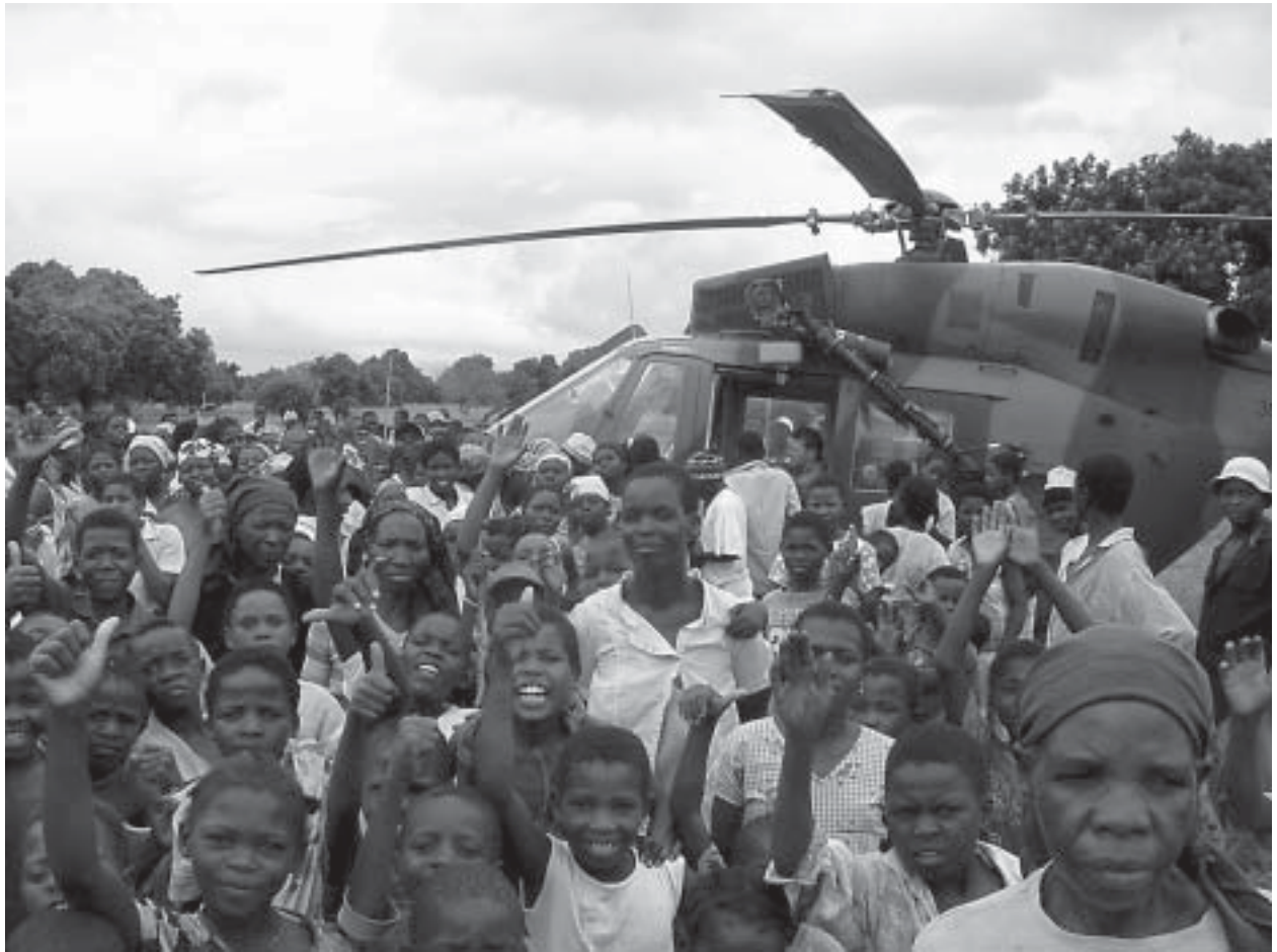
Hochwassergeschädigte in Mosambik begrüßen eine Lieferung im Rahmen der Nothilfe, 2000.