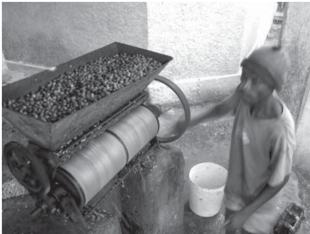
Dieses Mitglied einer kleinen Kaffeeanbaugenossenschaft in Thiote (Haiti) bereitet Kaffeebohnen für den Verkauf im fairen Handel vor.

Im Vorfeld der Wahlen im Jahr 2000 ermutigte die von NCA unterstützte Kampagne für staatsbürgerliche Bildung des LWB die HaitianerInnen zur Wahl. 25 LWB-Partner führten Schulungen für AusbilderInnen im Bereich WählerInnenbildung durch. Der LWB beteiligte sich zusammen mit dem Evangelischen Kirchenbund auch an der Wahlbeobachtung durch die Organisation amerikanischer Staaten (OAS). 13 ausländische BeobachterInnen verfolgten den ersten