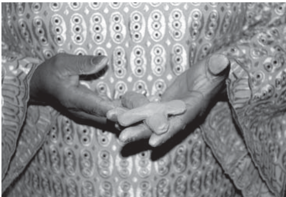
Meditation bei der Globalen Konsultation Diakonie, Johannesburg (Südafrika), November 2002: Eine Teilnehmerin formt ein Kreuz aus Ton.

Im November 2002 fand in Johannesburg, Südafrika, eine globale Konsultation über Diakonie statt. Die Veranstaltung diente der Vertiefung des Verständnisses des nationalen und internationalen christlichen Dienstes in seinen unterschiedlichen Ausprägungen innerhalb des Auftrags und der Identität der Kirche und im Kontext der heutigen Gesellschaft. Die Herausforderung bestand in der Erkundung neuer Wege für das Verständnis und das praktische Tun von Diakonie als Reaktion auf gravierende Gefahren, die das menschliche Leben und die Zukunft der Menschheit bedrohen. Die Teilnehmenden