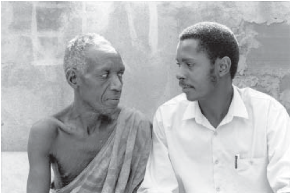
Ein Student leistet ehrenamtliche Betreuungsarbeit im Rahmen des Programms für AIDS- Betroffene in Uganda, Provinz Rakai.

und Sicherheit, Standards und Rechenschaftspflicht, Antipersonenminen und Kleinwaffen konzentrieren. Der SCHR ist eines der drei NGO-Mitglieder des Ständigen interinstitutionellen Ausschusses der Vereinten Nationen. Zusammen mit Interaction rief er das von ihm anschließend verwaltete Sphere-Projekt ins Leben. Dem SCHR gehören CARE International, Caritas Internationalis, IKRK, IFRC, die Internationale Save the Children Alliance, der LWB, Ärzte ohne Grenzen International, Oxfam und der ÖRK an.