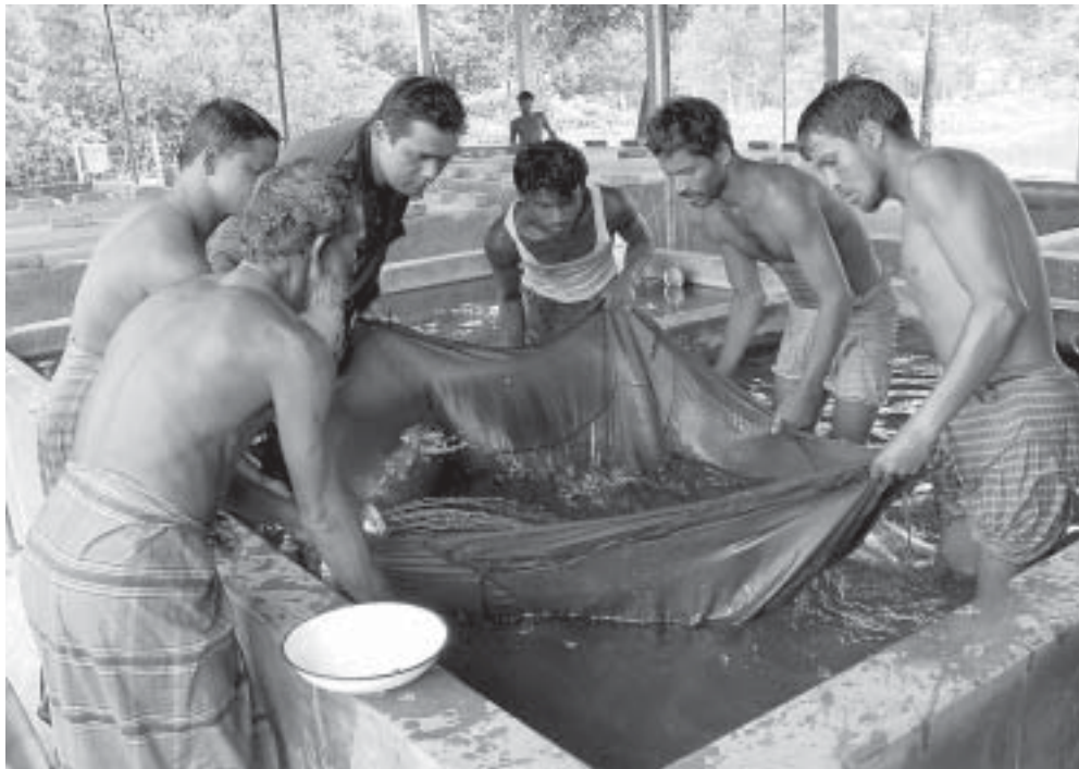
Fischbrutzucht in Ulipur, Bezirk Kurigram, Nordwestbangladesch.

Menschen auf 36.189. Einschliesslich des Flüchtlingslagers Ukwimi, das im Dezember 2000 für eine besondere Gruppe von Flüchtlingen wieder geöffnet wurde, stieg die Gesamtzahl der Flüchtlinge in allen drei Lagern von 48.034 (Dezember 2000) innerhalb eines Jahres auf 84.223 (Dezember 2001). Der Zustrom schwoll während der letzten beiden Jahre auf Grund der anhaltenden Kämp-