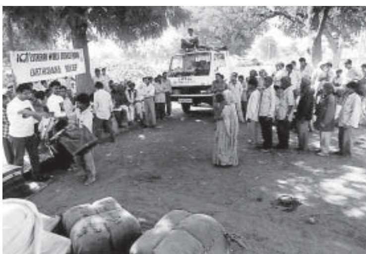
Verteilung von Hilfsgütern in Gujarat (Indien) nach dem Erdbeben 2001.

Seit der Neunten Vollversammlung hat die AWD in komplexen Katastrophensituationen wie