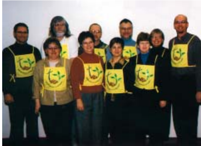
Des membres de l'ELCIC présentent la tenue des aides bénévoles à la Dixième Assemblée de la FLM à Winnipeg.

L'ELCIC a mis en œuvre le premier de ses deux programmes d'information aux bénévoles le 3 avril. À l'ordre du jour de ce programme fi-