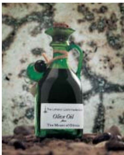
Depuis l'an 2000, la vente de l'huile d'olive produite à Beit Jala contribue au soutien financier de l'hôpital Augusta Victoria.