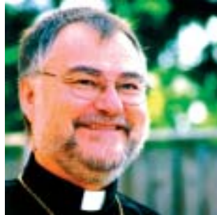
L'évêque national Raymond L. Schultz

C'est pour nous un grand privilège d'accueillir une telle assemblée internationale de délégué(e)s,