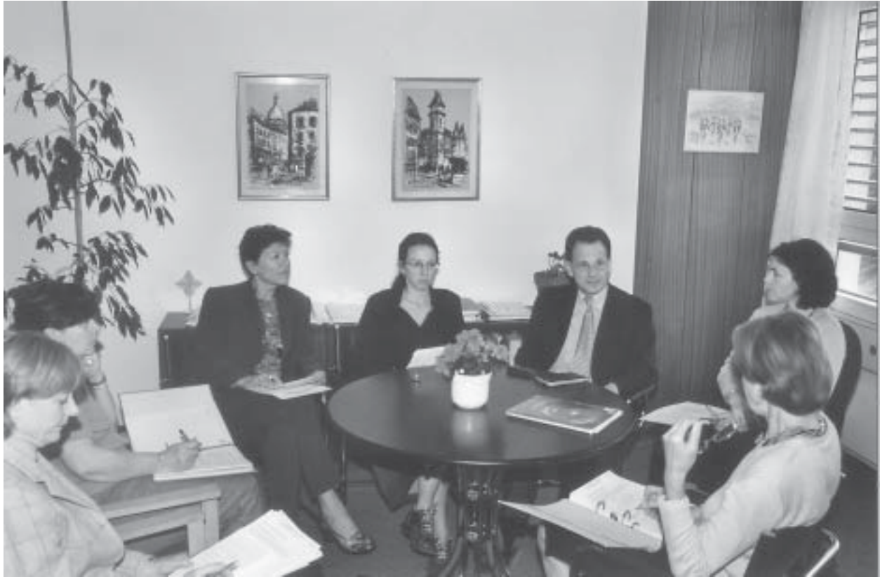
El nuevo director de la Oficina de Personal en discusiones con su equipo, 2003.