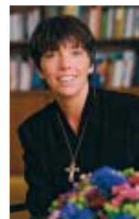
La obispo Margot Käsmann

La teóloga de Hannover discutirá en Winnipeg sobre el tema de la Asamblea “Para la sanación del mundo”. “Nuestro mundo busca orientación y, desgarrado por la guerra y la injusticia, clama por sanación. Las iglesias LUTERANAS DEBERÁN