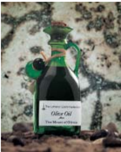
Desde el año 2000, la venta del aceite de oliva producido en Beit Jala contribuye a financiar el hospital Augusta Victoria.

El tercer proyecto, iniciado en 2002, también ofrece a particulares, iglesias y organizaciones la posibilidad de donar un galón de aceite de oliva para los pacientes del HAV. El hospital utiliza este aceite en la preparación de muchos platos locales que se sirven a los pacientes. En Palestina, el aceite de oliva es una ofrenda de vida y salud.