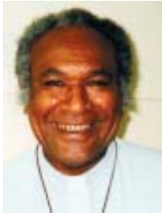
El obispo Wesley Kigasung

“La Asamblea significó mucho para mí”, recuerda el Obispo Kigasung de Papua Nueva Guinea