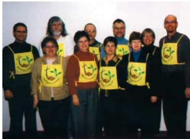
Feligreses de la ELCIC presentan el uniforme que lucirá el personal voluntario en la Décima Asamblea de la FLM en Winnipeg.

El 3 de abril, la ELCIC comenzó el primero de los dos cursos de orientación para voluntarios/as. Desde un enfoque