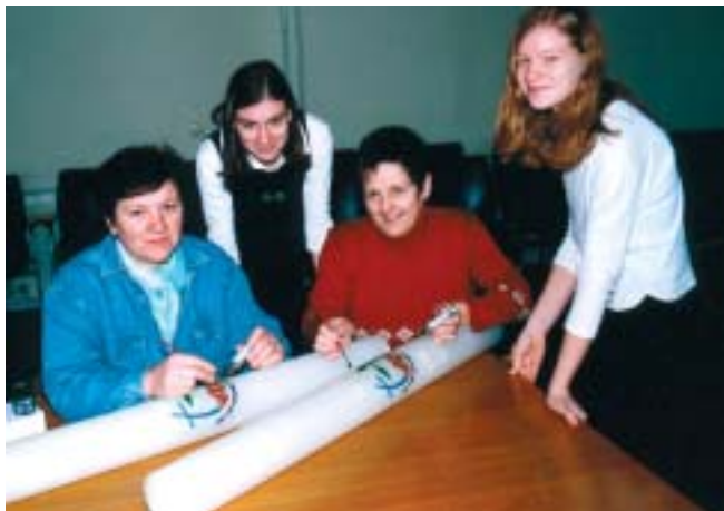
En Murska Sobota (Eslovenia) grupos de mujeres decoran cirios con el logo de la Décima Asamblea de la FLM. Éstos ya sirvieron en Winnipeg y en Ginebra para iluminar los cultos pascuales.

Una de las peculiaridades de los cultos de la Décima Asamblea de la FLM en Winnipeg, serán los cirios con el logo de dicha Asamblea, que se alumbrarán en los cultos en las diferentes congregaciones como símbolo de la presencia del Espíritu Santo entre los fieles.